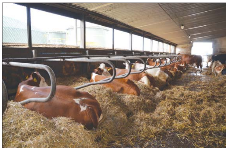
Struky udržujeme čisté tím, že bohatě nastýláme

V minulosti jsme se při práci na dojírně potýkali s určitými nedostatky. Dojiči vůbec neodstříkovali první mléko a téměř polovina krav odcházela