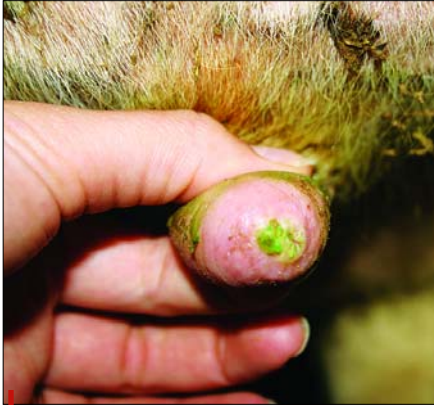
Prasklinky v kůži struku jsou ideálním místem pro množení bakterií

většinu bakterií na struku. Svoji precizní účinnost si navíc uchovává i při silném organickém znečištění. Velmi účinně působí i v podmínkách, ve kterých jiné přípravky, obsahující jód nebo chlorhexidin, selhávají.