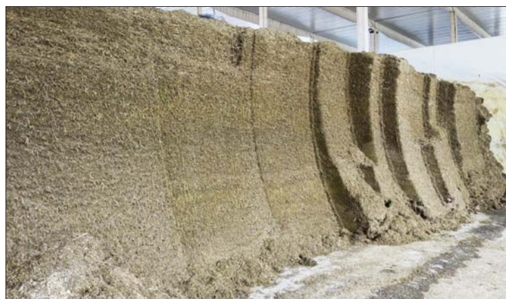
V Košetících a v Chyšné byly vystavěny nové silážní žlaby, které skýtají podmínky pro výrobu kvalitního krmení a hospodaření s takto vyrobenou hmotou

četinami, a museli jsme je vyřadit. Dnes už máme ověřeno, že stavy je nejlepší doplňovat i navyšovat z vlastních zdrojů. Také jsme si uvědomovali, že řada opakujících se zdravotních problémů a potíží s reprodukcí nemusí být vždy jenom problém daného zvířete, ale