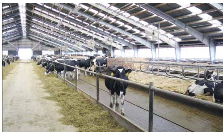
Do kravinů jsme nainstalovali ventilátory v kombinaci s mlžením a díky tomu přes léto udržíme vyšší nádoje i lepší zabřezávání

opatření a změny pro zvýšení pohody a zároveň výkonnosti krav na našich farmách. Brakace byla zaměřena hlavně na kusy s opakujícími se zdravotními problémy a časté přebíhalky. Jelikož jsme zároveň s tím chtěli udržet stavy, rozhodli jsme se v několika vlnách nakoupit vysokobřeží jalovice. Dnes už si můžeme popravdě říci, že takto nakoupené jalovice neprokázaly přínos, jaký jsme čekali. Některé nezvládly přechod do našich stájí, zejména kon-