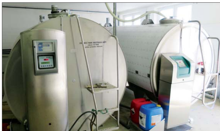
Posledním zlepšením, které jsme v březnu uvedli do provozu, je zrekonstruovaná mléčnice s navýšenou kapacitou pro skladování i chlazení mléka včetně rekuperace pro úsporu nákladů

z nich Cilka po býkovi Mr. Moon je na 12. laktaci a má nadojeno přes 135 tisíc kilogramů mléka. Druhá nejstarší, Běta po býkovi Joke, je na 10. laktaci a nadojila přes 118 tisíc kg mléka. Poslední je Lidka po býkovi Jalapeno, která je na 9. laktaci a má nadojeno přes 104 tisíc kilogramů mléka.