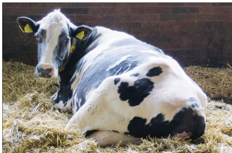
Nejstarší kráva Cilka po býkovi Mr. Moon je na 12. laktaci a má nadojeno přes 135 tisíc kilogramů mléka